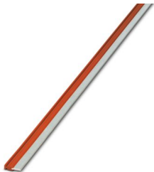
Puente enchufable sin fin, longitud: 500 mm, color: rojo

Tenga en cuenta que los datos mostrados en este documento PDF se generaron a partir de nuestro catálogo online. Por favor, encontrará todos los datos en la documentación del usuario. Prevalecen nuestras condiciones generales de uso para descargas.