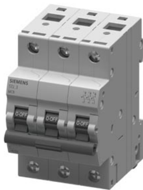
SINOVA, PIA 415 V 6 kA, de 3 polos C, 10 A